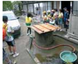
▲井戸を発見した様子