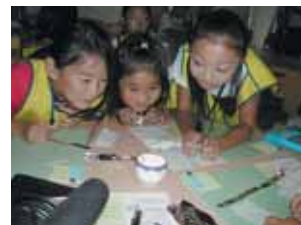
▲簡易ランタンづくり