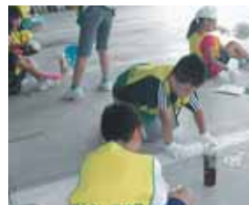
▲サバイバル炊飯体験