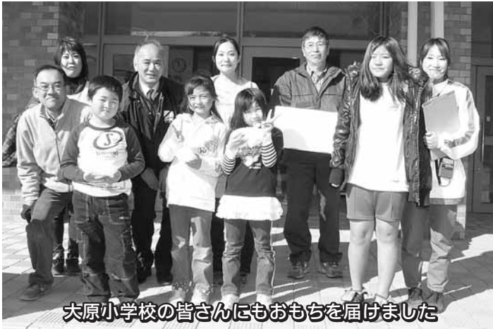
大原小学校の皆さんにもおもちゃを届けました