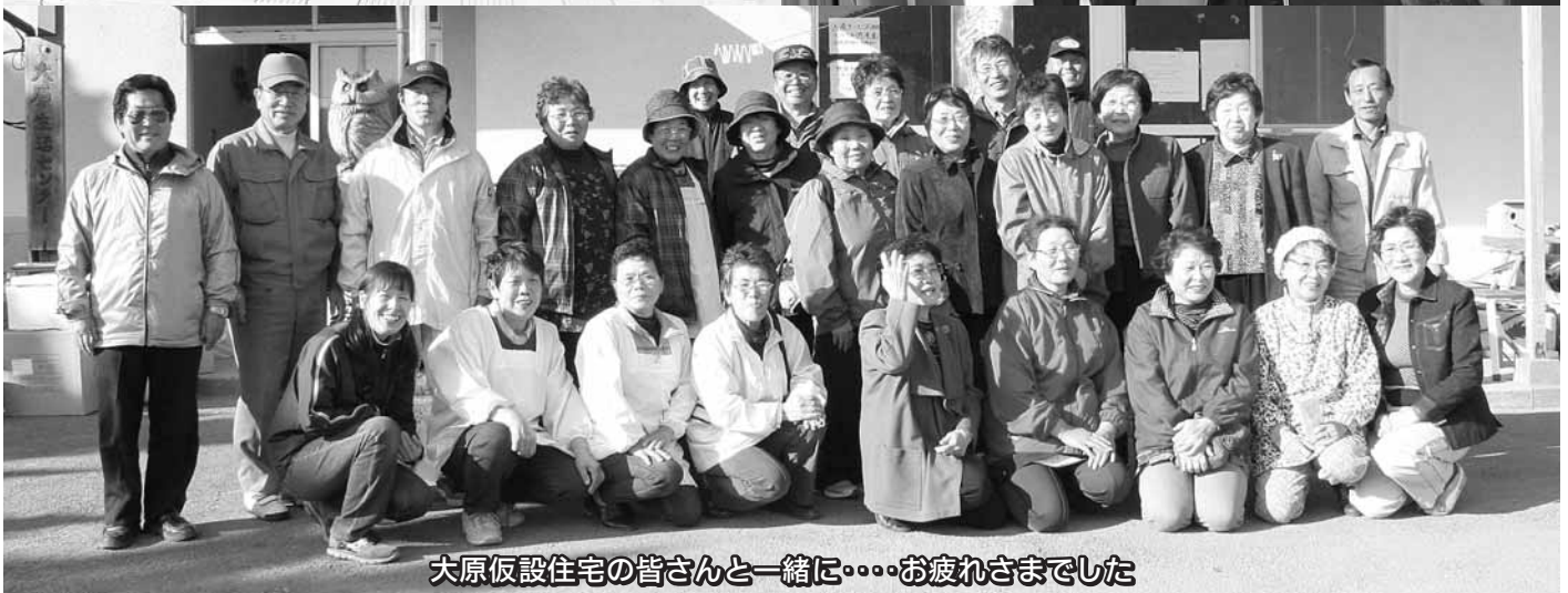
大原仮設住宅の皆さんと一緒に……お疲れさまでした