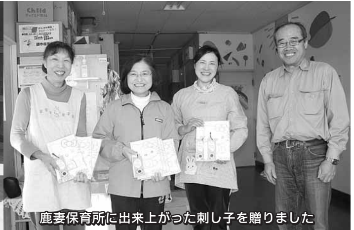
鹿妻保育所に出来上がった刺し子を贈りました