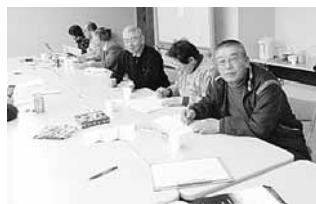
作業中のまち協職員

12月号でお願いしておりました、『震災ふりかえりアンケート』へ多大なるご協力をありがとうございました。現在まち協委員による集計作業を行っており、今後皆様に結果をお知らせいたします。