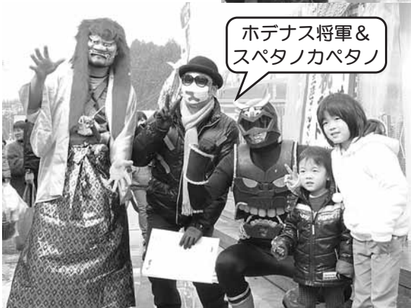
ホデナス將軍 & スパタノカバタン

当日は、三本木ご当地ヒーローの「オダスナー」や「ホデナス將軍&スパタノカバタン」も会場に駆けつけ、さんさん商店街の復興イベントに登壇！