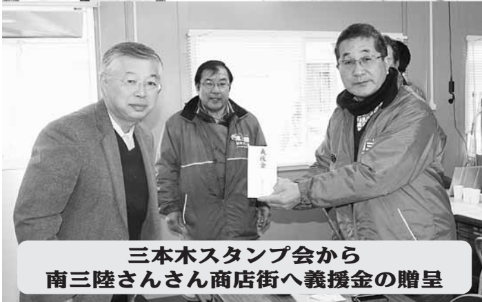
三本木スタンプ会から 南三陸さんさん商店街へ義援金の贈呈