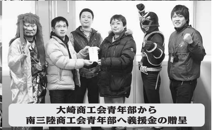
大崎商工会青年部から 南三陸商工会青年部へ義援金の贈呈

2月26日、南三陸町志津川地区に、被災した30店が協力し「さんさん商店街」が完成しました。三本木スタンプ会では、年末年始大売り出しに参加各店の店頭で集めた義援金を届け、大崎商工会青年部も集めた義援金を南三陸商工会青年部へ届けました。