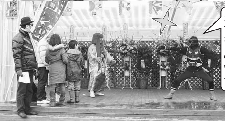
巷で噂の 三本木ご当地ヒーロー 「オダスナー」参上!!