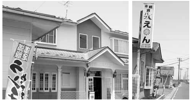
場所はYKKap北星寮へ入った通りの左側