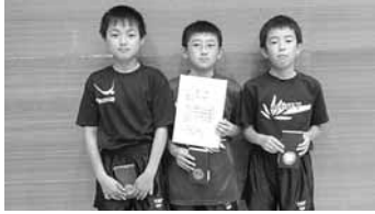
団体戦で北日本大会へ!