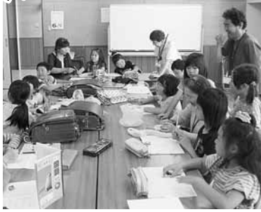
宿題だって楽しいね。

宿題の後のドッチビー大会大きなお兄さんやお姉さんと一緒に初めてののちびっこもがんばっていました。