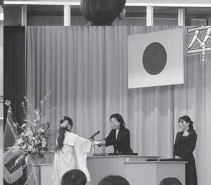
三本木公民館長より卒業祝い品が授与されました。