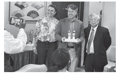
▲送別会で市長へこけし贈呈

家に戻り妻のつくったお煮しめとお酒をいただき、ぐっすり眠った。長いようであるという間の8日間のダブリン訪問であった。さて、来年4月にはダブリンからの訪問団の受け入れである。早速準備にかからねば。