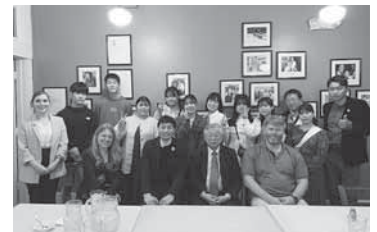
▲夕食会で集合写真