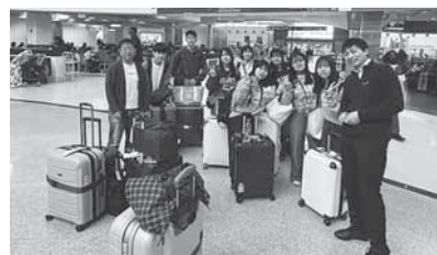
▲アトランタ空港帰国へ