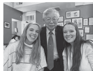
▲キャミーとエミリーと