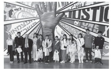
▲公民権人権センターで