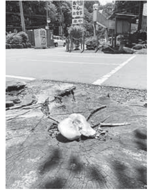
▲ドライブの途中で偶然出会った「金のきのこ」