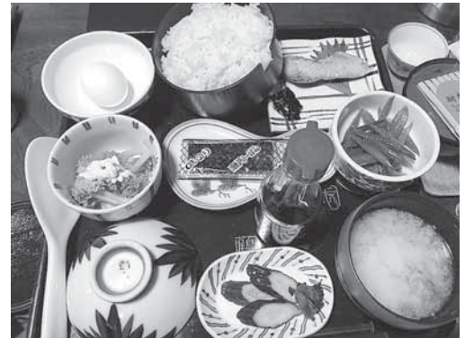
▲秘境・肘折温泉の朝食