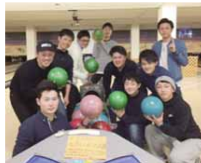
未来の三本木につながる活動がしたいと集まった三中卒業の仲間たち