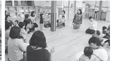
出前一丁あそびの会(蟻ヶ袋)