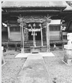
向拝欄間の彫刻がある拝殿