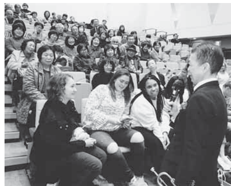
▲ダブリン姉妹都市交流団で三本木に滞在中の高校生達と

大勢の皆様にご来場いただき大盛況のうちに終了しました。当日は三本木にホームステイしていたダブリン市の高校生10名と付き添いの皆さんも鑑賞しました。