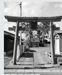
表通りから見た様子