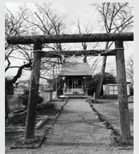
大正18年に建立された鳥居