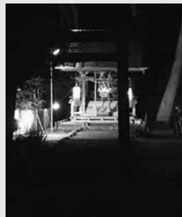
元朝参りの時の様子