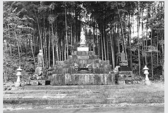
地藏尊 向かって左が水子地藏 右が火伏地藏