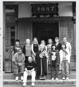
ダブリンの高校生と (2002年6月)