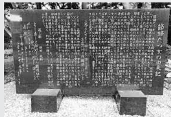
節婦辰女の由来記