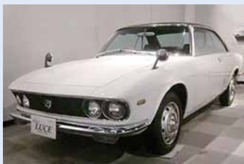
昭和40年ごろの あこがれの国産車 マツダルーチェ