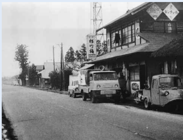
昭和40年ごろ 国道4号（坂本地区）