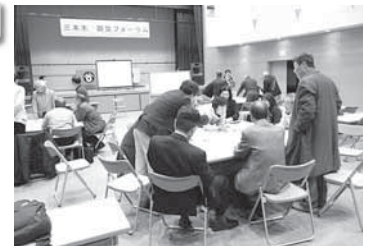
D I G訓練の様子

今回の三本木防災フォーラムのレポートについては、さんぼんぎねっと3月号より掲載して参ります。