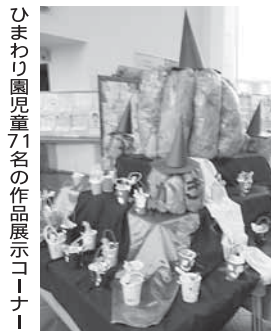
ひまわり園児童71名の作品展示コーナー！