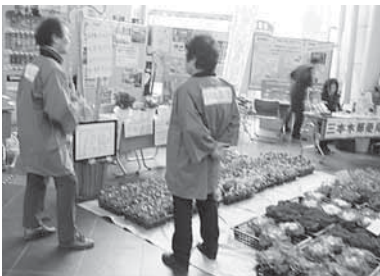
環境生活部会の鉢植え、花苗の販売コーナー。市価よりも安く販売され人気でした。