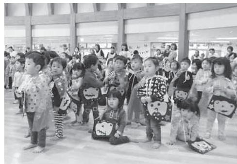
▲ハロウィン当日の31日には園児がホールに集まってパーティーが開かれました。