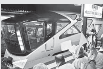
8月鳴子温泉駅でのお出迎えの様子

なお、車でお越しになる方は鳴子総合支所裏の湯めぐり広場駐車場にご駐車をお願いします。