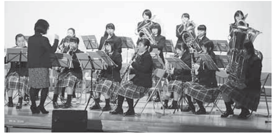
三本木中学校吹奏楽部から「やってみよう」「宝島」などが演奏され、会場から大きな拍手が送られていました。