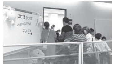
保健福祉センター2Fのまち協事務室がゲーム室に・・・

10月29日(日)、三本木総合支所および保健福祉センターを会場に三本木文化祭が開催されました。展示の部には文化協会加盟団体をはじめ22団体、三本木小学校4年生による合唱からスタートしたステージ発表の部は、17の団体と個人が参加し日頃の練習の成果を披露しました。その他JA婦人部が芋煮、焼き鳥などを販売、古川消防署三本木出張所からは応急手当普及啓発と体験コーナーが設けられました。また今回、まちづくり協議会教育部会は、ひまわり園保護者会、三本木小学校、中学校PTAと協力し初めて開いた「こども広場、夢のワンダーランド」では射的や輪投げなどのゲームコーナーを設け、大盛況！子どもたちが行列をつくるほどにぎわっていました。(写真右)