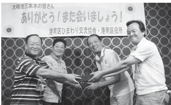
▲ありがとうございました。来年は大崎で！