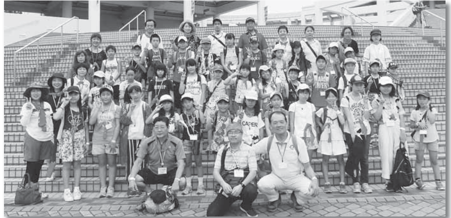
▲大興奮のシーパラダイス。イルカやペンギンも可愛かったね