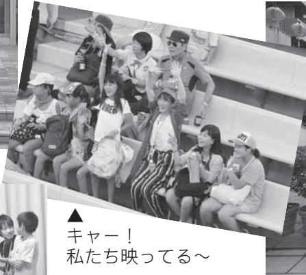
▲キャー！ 私たち映ってる～