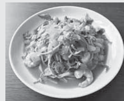
海老と大葉の和風トマトソースパスタ 850円+税 生パスタにすると +240円+税

ピザ 18cm / 24cm 各種 お持ち帰りメニュー、パーティーメニューもありますのでお気軽にお問合せください。