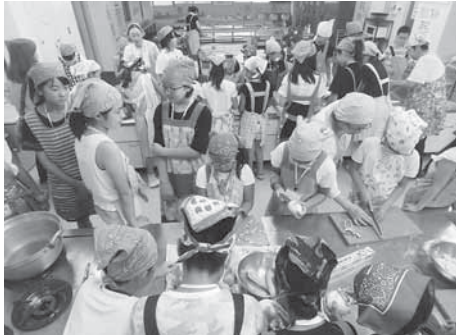
▲玉ねぎに泣かされました