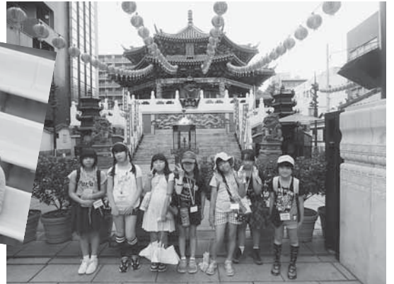
▼中華街を探検後本場の中華料理を満喫。お別れの記念写真