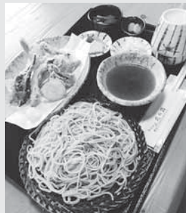
人気メニューの「天ざる」1,250円 黒竹のざるに盛り付けられたそばは、のどごしよく風味豊か

手打ちそば 花の路 大崎市三本木南谷地要害347-4 ☎ 0229-52-6860