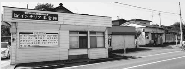
かつて魚屋だった、インテリア本宮 右隣はバイパス美容室