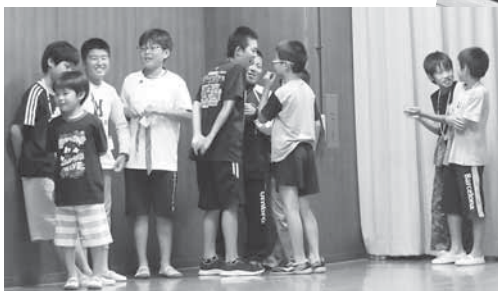
▲なぞなぞ問題相談中