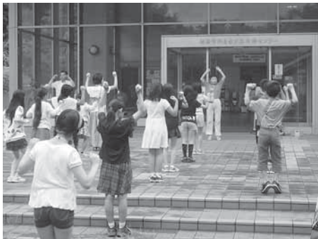
▲毎朝元気にラジオ体操