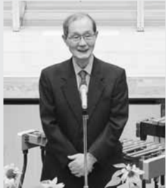
手代木三本木文化協会会長

10月30日(日)、第42回三本木文化祭が三本木総合支所ふれあいホール、保健福祉センターを会場に開催されました。