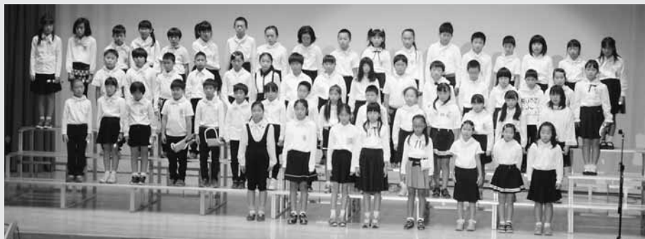
三本木小学校4年生による合唱「夢をのせて」「365日の紙飛行機」、合奏「聖者の行進」