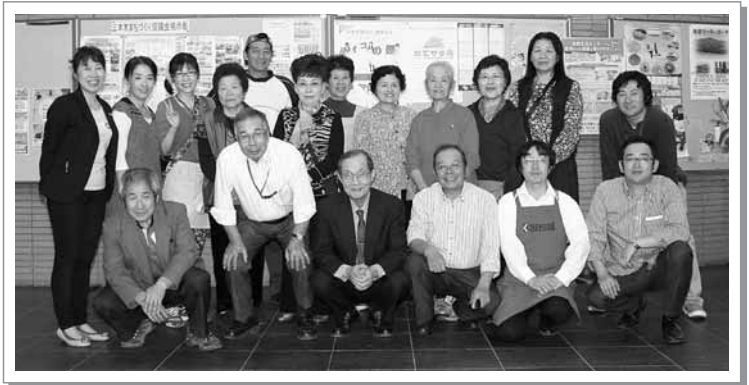
最後まで後片付けをしてくれた文化協会、まち協、参加団体の皆さんお疲れ様でした。