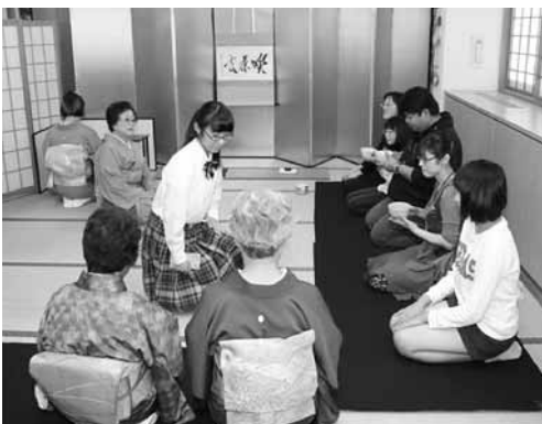
三本木茶道愛好会 お茶会