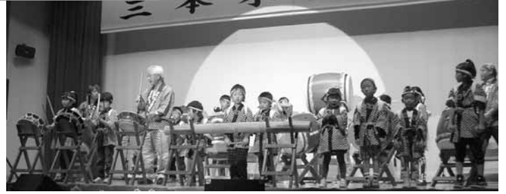
仲町保食八幡太鼓、仲町地区の幼稚園児、小学生による和太鼓演奏▲