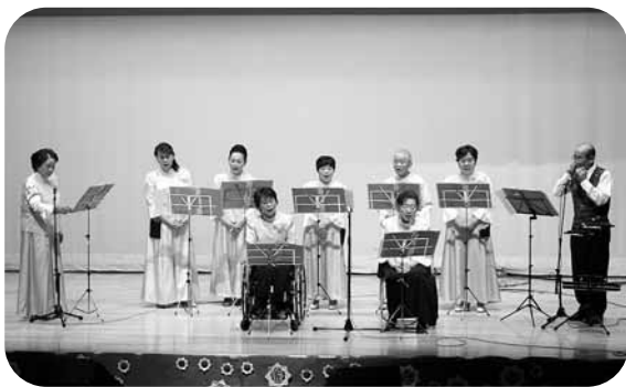
ひまわりハーモニカのみなさんの演奏「長崎の鐘」「古城」「川の流れのように」は旅情たっぷり