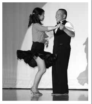
三本木ダンス愛好会の「ルンバ」