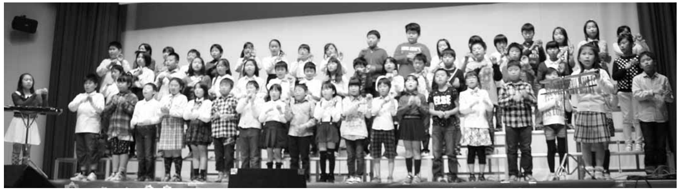
▼三本木小学校4年生による合唱奏、「花は咲く」の曲にあわせた手話 トリコーダー鍵盤ハーモニカと合唱によるコラボレーション