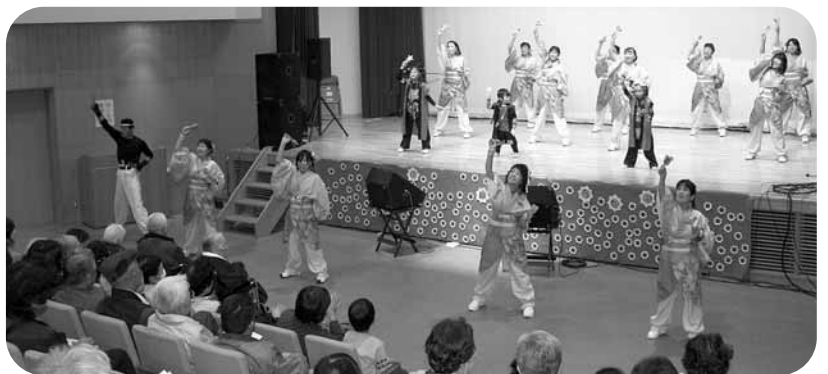
愛燦舞のよさこい演舞は「楽園」、「絆」、「よっちゃれ」の3曲で会場は活気づきました。