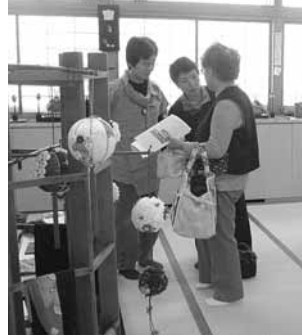
お針箱グループの作品に皆さん興味津々な様子です